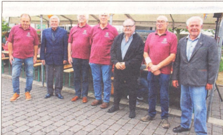
Das Lampionfest war der richtige Rahmen für die Ehrung treuer Mitglieder.