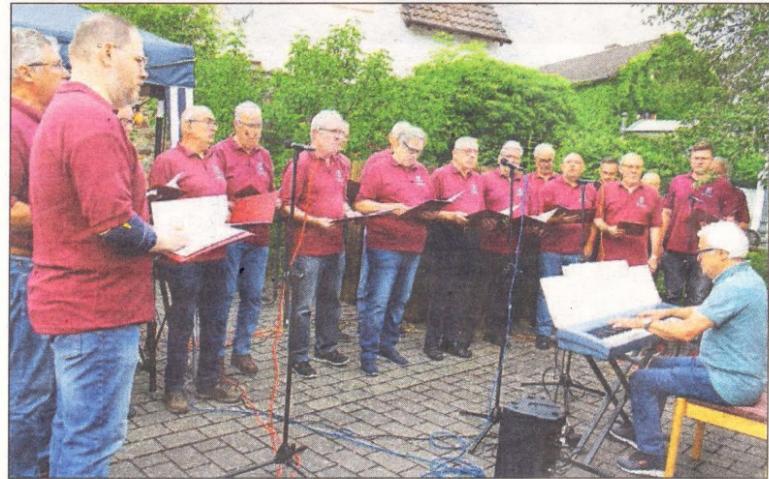
Die Johannisberger Sänger erfreuten ihre Festgäste an beiden Festtagen mit einem Ständchen.

Johannisberg. (fla) – „Wenn die Arbeit getan und der Abendfrieden beginnt, schau'n die Menschen hinauf, wo die Sierra im Abendrot brennt. Und sie denken daran, wie schnell ein Glück oft vergeht. Und aus tausend Herzen erklingt es wie ein Gebet: Sierra, Sierra Madre del Sur“, sangen am Samstagabend rund zwei Dutzend gestandene Männer passend zum Sonnenuntergang hinter dem Johannisberg. Unter dem großen, schützenden Zelt im Hof des Pfarrzentrums hatten dazu viele Gäste Platz gefunden und genossen die letzten Sonnenstrahlen dieses Tages. Dazu funkelte der goldene Wein in den Gläsern, als die Sänger der Cäcilia Johannisberg ihren musikalischen Begrüßungsreigen mit „Sierra Madre“, dem folgenden Trinklied, dem Fliegermarsch und der „Fröhlichen Welt“ an-