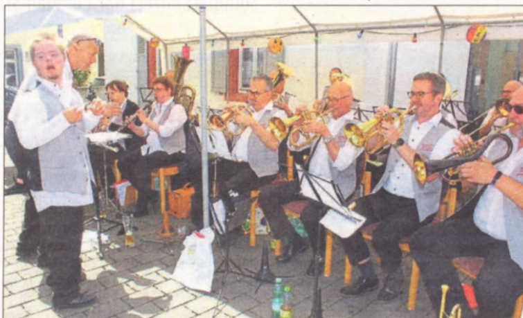
Am Sonntag spielte die Blaskapelle Weindorf Johannisberg auf.