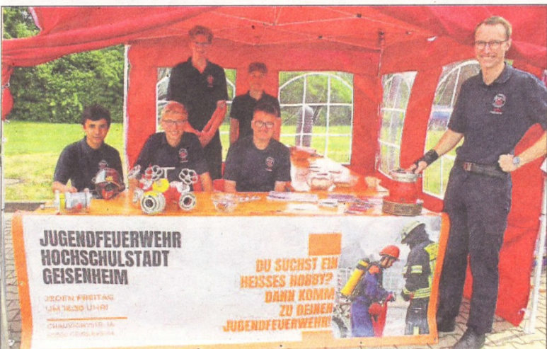
Die Jugendwehr bot viele Informationen und lud zum Basteln und Malen.