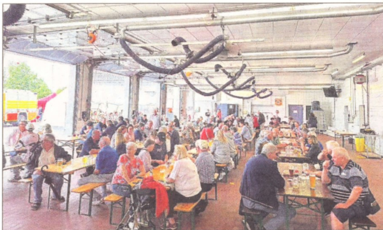
Nach dem Schreck am Morgen waren viele Gäste gekommen, um mit den Geisenheimer Feuerwehrleuten zu feiern.

Der Nachmittag war dann auch die richtige Zeit für Kaffee und Kuchen, selbst gebacken von den Feuerwehrfrauen. Wahre Tortenträume mit Mar-