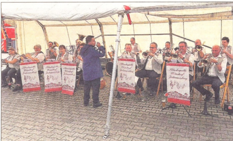
Die Musikkapelle Weindorf Johannisberg spielte zünftig zum Frühschoppen auf.