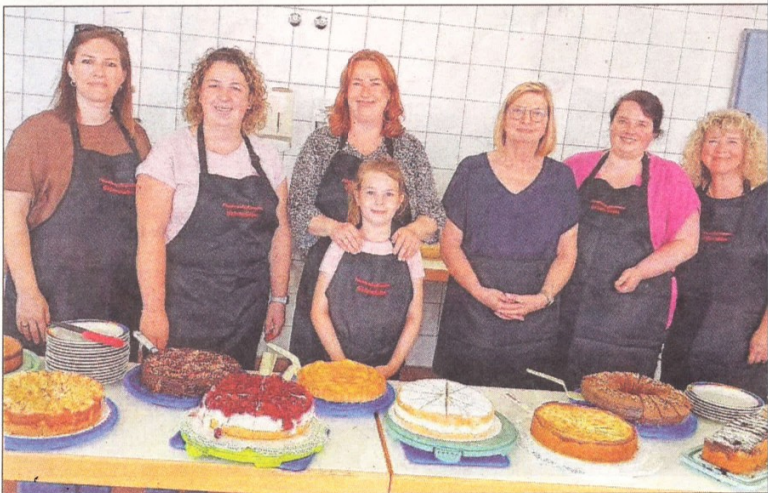
Wahre Kuchenträume hatten die Feuerwehrfrauen im Angebot.