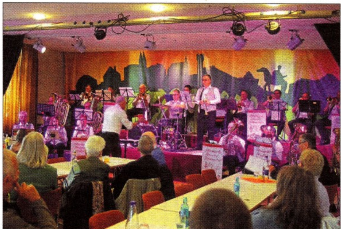
Die Blaskapelle Weindorf Johannisberg hatte zum Konzert an Ostermontag geladen.

den in Geisenheim am 15. Juni zu Gast. Weitere Termine folgen im Verlauf des Jahres.