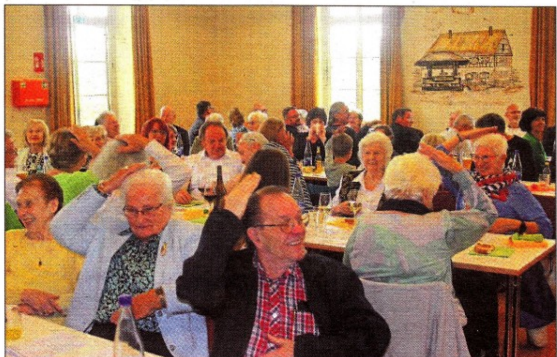
Viel Gelächter gab es beim Versuch, mit einer Hand den Bauch zu reiben und gleichzeitig mit der anderen auf den Kopf zu schlagen.