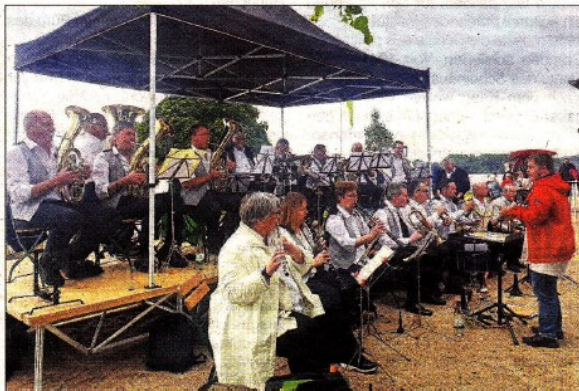
Die Blaskapelle Weindorf Johannisberg spielte am frühen Nachmittag.