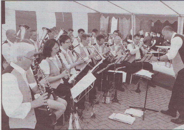
Die Blaskapelle Weindorf Johannisberg gehört zur Feuerwehr wie der Sauerstoff zum Feuer.

Kuschelpolka und Knorzen-Grill: Viel Volk beim Tag der offenen Tür der Feuerwehr