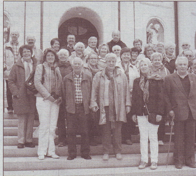
Der Jahrgang 1938 Geisenheim unternahm einen Ausflug nach Garmisch-Partenkirchen.

Geisenheim. – 75 Jahre – ein Anlass zum Feiern – aber auch ein Grund dankbar zu sein. Dankbar, dieses Alter bei einigermaßen guter Gesundheit erleben zu können. Um diesen Dank zum Ausdruck zu bringen, hatte sich der Jahrgang, einige Tage vor dem Ausflug, zu einem ökumenischen Got- tesdienst im Rheingauer Dom zusam- men gefunden, aber auch, um den verstorbenen Kameradinnen und Kam- eraden zu gedenken.