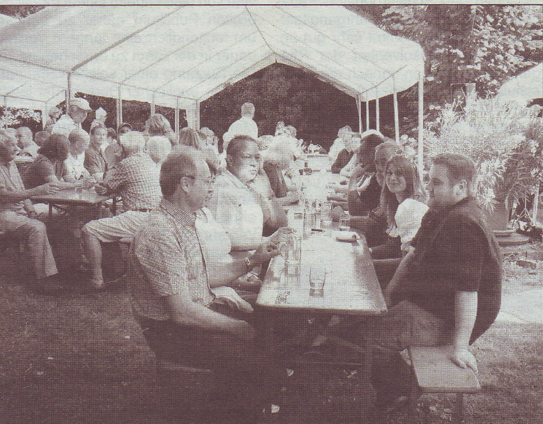
Die Wiese am alten Wäschbrunnen ist wie geschaffen für ein lauschiges Sommerfest.