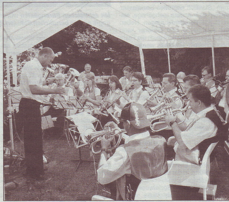
.... genau wie die Blaskapelle Weindorf Johannisberg.